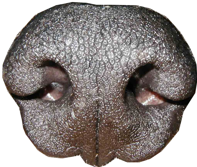
Hundens næse er et formidabelt sanseorgan - og hundens primære informationskilde. Næsen tilhører forfatterens hund »Dino«.

Fra naturens hånd er hunden udstyret med en formidabel lugtesans. Vildhundens eller ulvens overlevelse i naturen afhænger i høj grad af dens evne til at opsnuse føde - herunder evnen til at forfølge sporet af et byttedyr. Kunne den ikke det, ville dens skæbne hurtigt være beseglet.