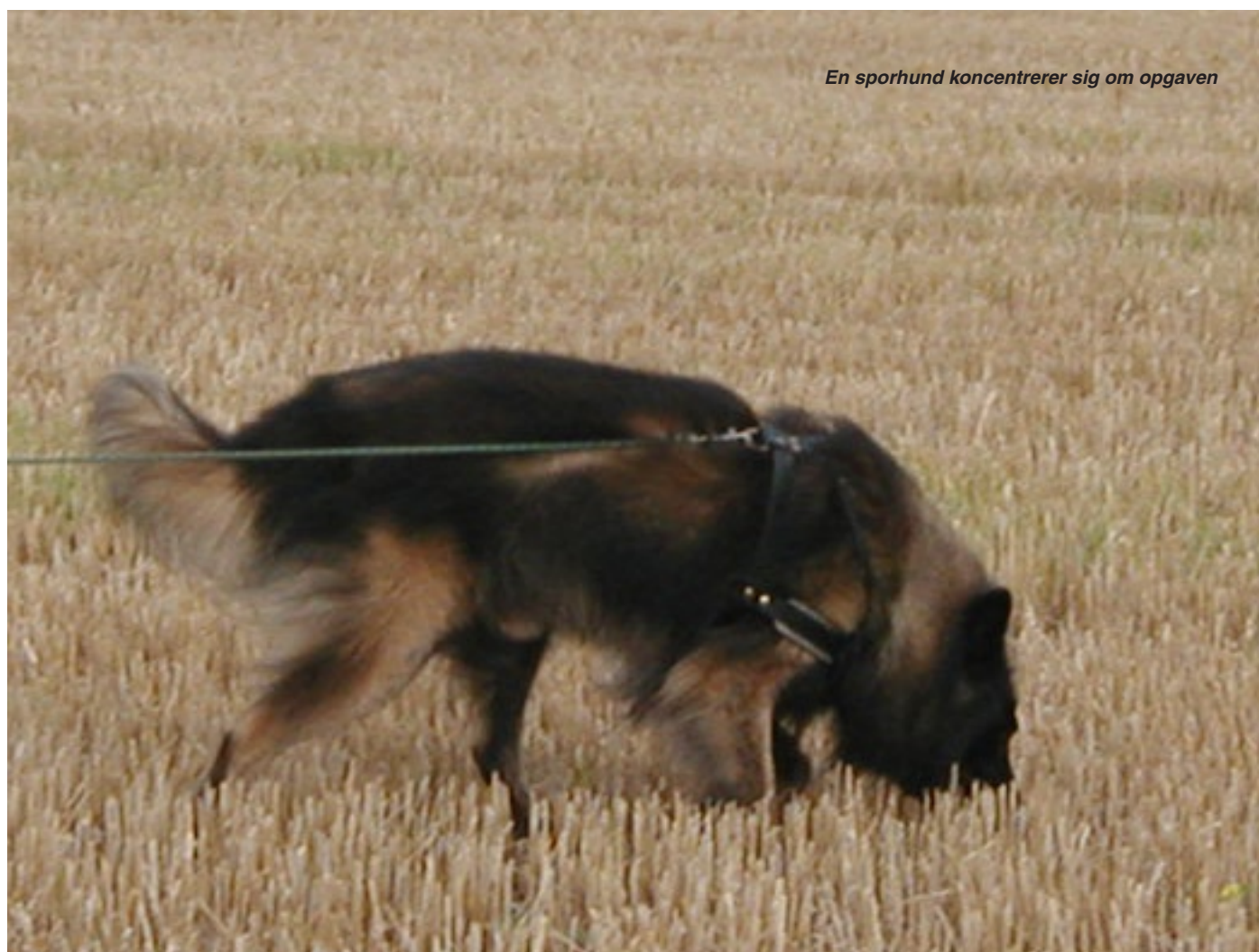
En sporhund koncentrerer sig om opgaven